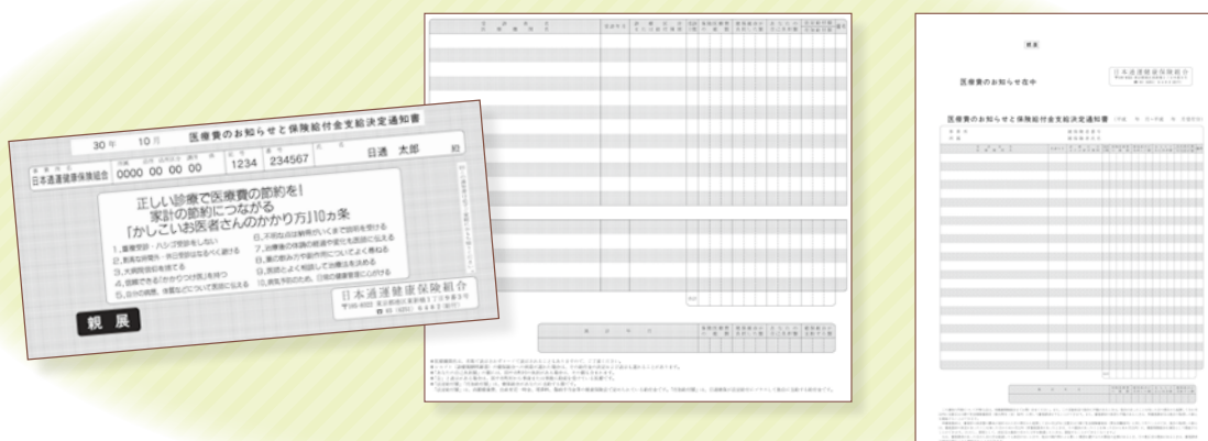
▲ 任意継続被保険者用